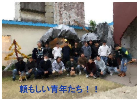
頼もしい青年たち！！