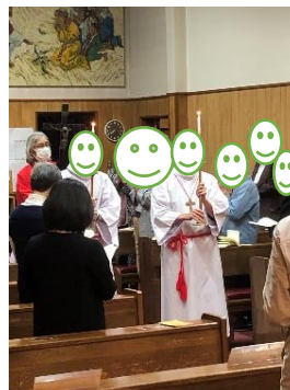
4/15 聖金曜日 十字架礼拝