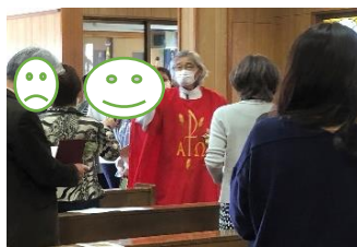
4/14 聖木曜日 聖体安置式